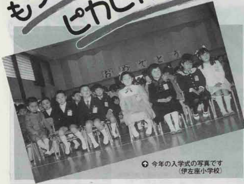
① 今年の入学式の写真です (伊左座小学校)