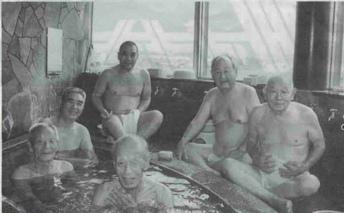
↑見晴らしのいい展望風呂につかれば、気分は最高!!