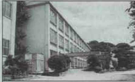
杣 小 学 校