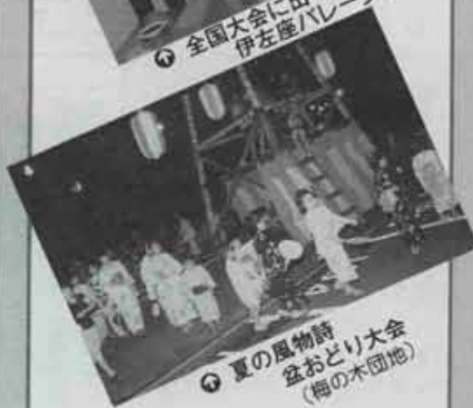
② 夏の風物詩 盆おどり大会 (梅の木団地)