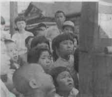
③ 紙芝居に見入る子供たち

当時の筑豊の子供たちには紙芝居が一番の楽しみ。水あめ売りの回りには、いつも人だかりができました。