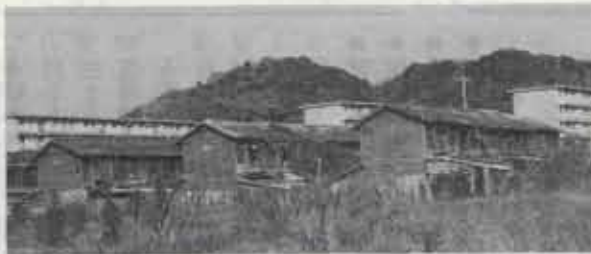
▲ 今に残る古賀地区の二階建て炭住

績をあげていると聞いて早速これを採用した。しかもここでは、坑底から地上の貯炭場までを一連のベルトコンベアで連結して、それを運炭場の一端にある中央操作室のスイッチで、自由に操作できるようにしたので、わが国においては初めての採炭流れ作業が開始された。