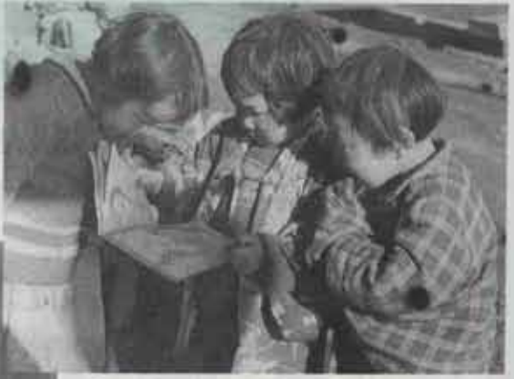
② 絵本を見ている子供たち