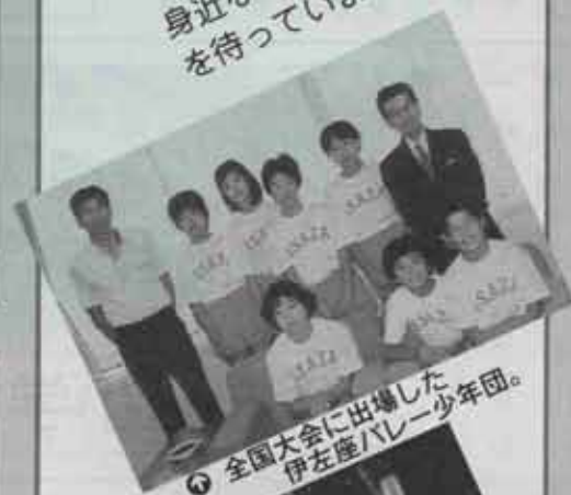
① 全国大会に出場した 伊左衛門バレー少年団。