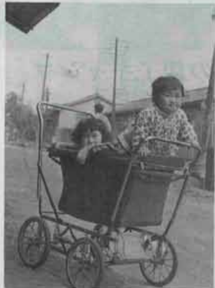
① 乳母車に乗る姉と妹

一抗の鉱員社宅内(吉田片山)で遊ぶ子供たちのスナップ写真です。当時の生き生きした子供たちの様子がうかがえます。