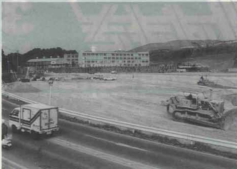
▲ 造成中のベントナイト工業跡地

町はこの開発計画に合わせて、都市計画道路と用途地域の一部を変更し、新しい町づくりを目指します。