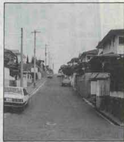
▶ 第二種住居専用地域となつた高尾団地

今回の見直しは、一昨年ベントナイト工業（株）が移転し、工場の跡地が宅地開発されること