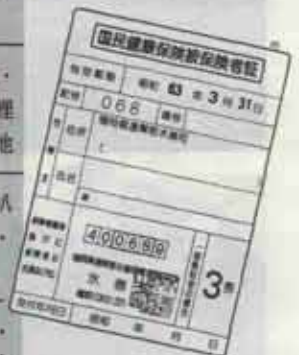
この保険証は切替えですよ