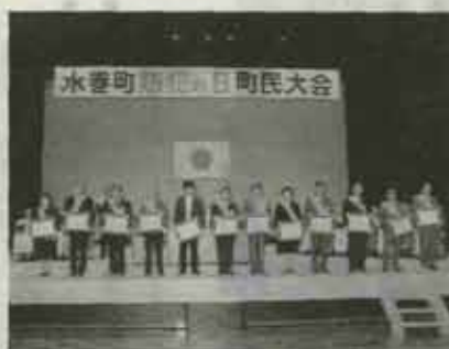
この日表彰された防犯功労者のみなさん

水巻町防犯の日大会が十一月八日、中央公民館で約四百人が参加して開催されました。 大会では、防犯功労団体(二団体)と防犯功労者十二人が表彰され、水巻中学校の生徒六人が意見発表を行いました。 表彰された方々は次のとおりです。 功労団体 ●頃末南区防犯組合 ●高尾団地防犯組合