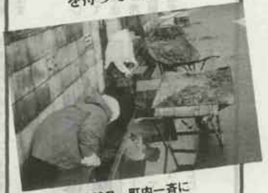
11月29日、町内一斉に満掃除が行われました。