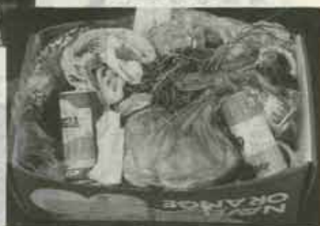
空カンや生ごみがごちゃごちゃに出されていました。こんなごみはゴメンですネ。

集日が守られてないところがあります。ビン・カン類と生ごみがいっしょに出されたりしていますので、仕分けに手間がかかっています。