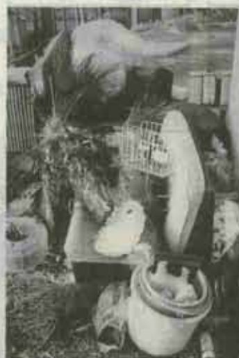
▲収集日の前日なのにこんなにごみの山が。これではまるでごみ捨て場ですね。