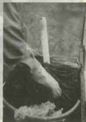
▲燃えるごみの中に蛍光管が投げ込まれていました。気付かずにケガをすることもあるんですよ。