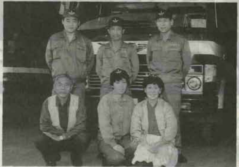
▲(有)水巻美化センターのみなさん (頃末から南部を収集しています。)

める人や処理をする人たちがいて、まちがき はつい忘れてしまっはいいないでしょうか？ 実態を密着取材してみました。ここに照会ま うか目をそらさず読んで下さい。そして、 あなたのごみを思い出して下さい。