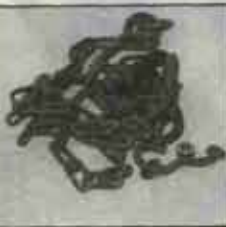
こんなものが燃える ごみの中に入ってい ました。

■スプレー缶や電池・油缶などの 危険物が燃えるごみの中に入っ ていると、焼却炉の中で爆発して職 員がケガややけどをしたことがあ ります。それに、金属などの燃え ないごみが一割以上も混ざってい て、燃えかすを運ぶコンベアーが 故障したこともあります。