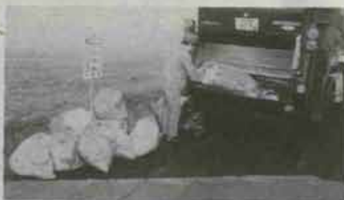
▲きちんと仕分けがされ、袋の口をしっかりと 結んであると収集作業もスムーズです。