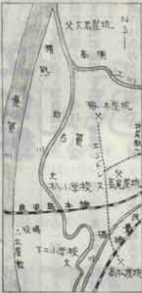
大正八年の三好炭坑(株)

これは「高松キナコ」の項で書いた炭坑頃であるが、これによって三好炭鉱が筑豊の三大压制ヤマであったことが