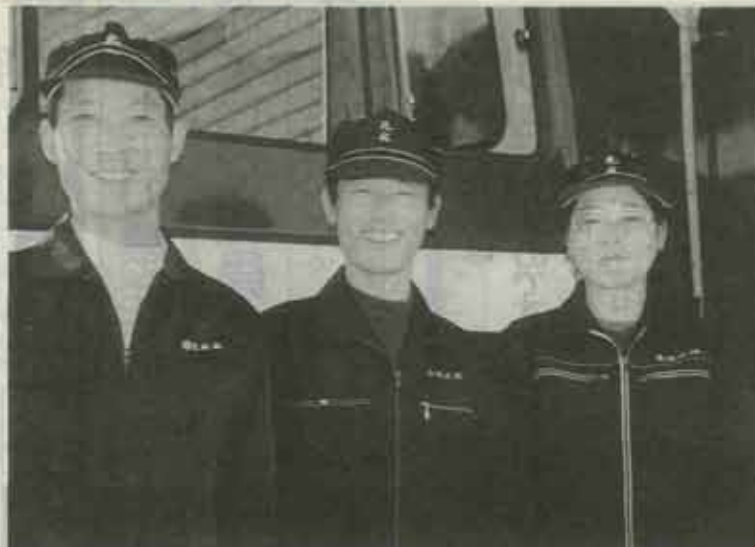
▲(有)北水社のみなさん (町の北部を収集しています。)

なにげなく出す家庭のごみも、それを集れいになっていきます。そのことを私たち今回は、清掃車に乗って、ごみ収集のきるのはほんの一部に過ぎませんが、どあのオルゴールが聞こえたら、もう一度