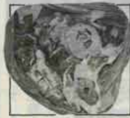
洗濯機も破砕機でこ んなに小さくされま す。