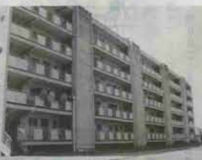
前廊下方式の鯉口団地

昭和六十二年八月二十日現在で二二〇戸中の未納者は一〇人です。未納者一〇人の内訳は、 ● 分割納入中三人