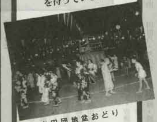
吉田団地盆おどり