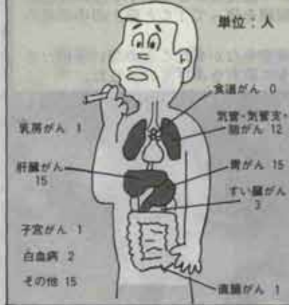
●図1 水巻町のがんの部位別内訳(S61年)

図1を見て下さい。 水巻町では、胃・肝臓・気管支・肺が高位を占めているようです。