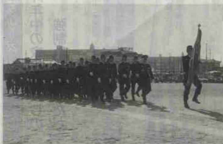
太陽の日射しを浴び、力強く行進する水巻町消防団