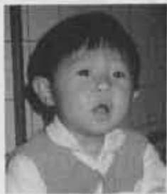
はじめまして、散髪屋の看板娘、秋奈です。少食で悩ませているけど大丈夫、とても元気なもんね。お外とトマトジュースが大好きです。みなさんヨロシクネ! (吉田一八三五)