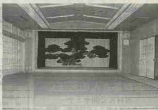
58畳、舞台つきの和室 (1階)