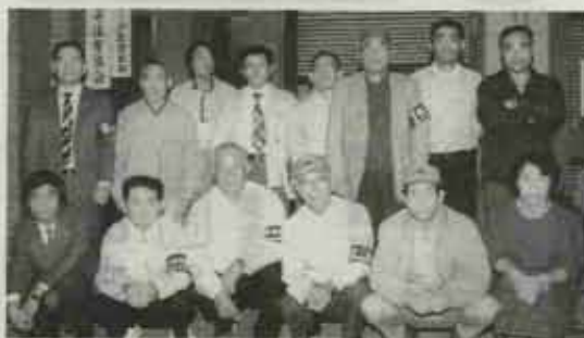
夜間補導を行う防犯協会役員と青少年協推進委員さん

「侵入盗の防止」「少年非行の防止」を呼び掛ける全国防犯運動(十月十一日〜二十日)に合わせ、水巻町でも防犯協会と青少年問題協議会を中心に夜間の少年補導や街頭キャンペーンなど、防犯活動を展開しました。十四日には、水巻町防犯協会の役員や折尾警察署員ら十六人が水巻駅前や運動者や通学者にチラシやティッシュペーパーを配って、防犯への協力を呼び掛けました。十六日には、青少年問題協議会の推進委員と防犯協会の役員が合同で、夜間の少年補導を行いました。