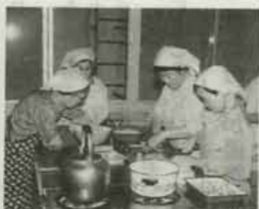
料理を作られる食生活推進委員さん