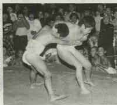
子供たちの力が入った取り組み

ハッケヨイのこった! のこった! のこった! 頃末伊豆神社の境内では、チビっ子たちの相撲が行われました。秋の収穫をまじかにひかえ、今年の豊穡を感謝する御九日(おくんち)が町内の神社で行われました。頃末地区では十三日、伊豆神社に沢山の区民が