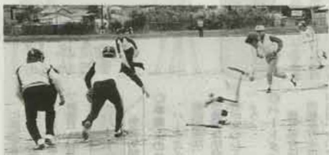
ヒット/ヒット/楽しいふんいきでのソフトボールの試合

晴折、うす日が差す秋空の下、体育の日スポーツ行事として、壮年ソフトボールとレクリエーションバレーボール大会が十月十二日に開かれました。会場の吉田小学校と南中学校には、町内からソフトボール十九チーム、三百二十三名、バレーボール十八チーム・三百四十二名が参加。家族や地区の応援をうけながら熱戦が繰り広げられました。試合の結果は次のとおり。