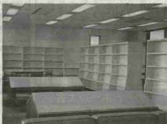
図書室 (2階) 5,000冊の本があります