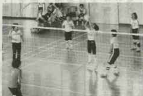
はいとス、スパイク/ハッスルプレーの選手