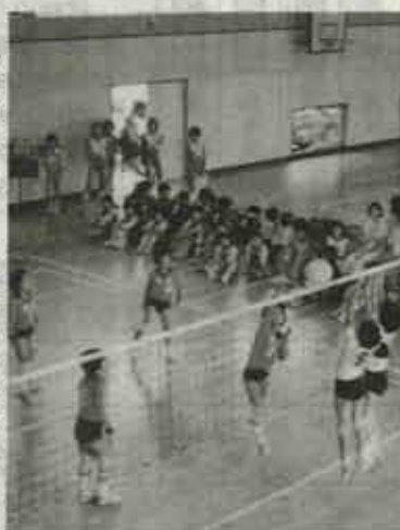
熱戦のバレーボール大会

町内のスポーツ少年団は、夏休みを利用して活発な活動を行ってきたが、その総まとめとしてバレーボール、水泳、剣道、野球の四スポ