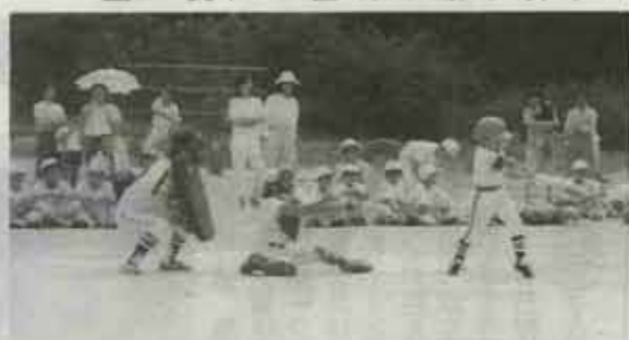
父母の応援をうけハッスルプレーが目立つた野球大会