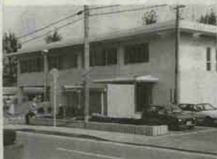
完成まじかな福岡法務局水巻出張所

福岡法務局水巻出張所の新庁舎が完成し、「十月十三日(月)」から業務を行います。新庁舎の場所は、役場庁舎の横(国道三河線側)です。