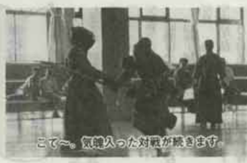
こて〜。気晴らした対戦が続きます