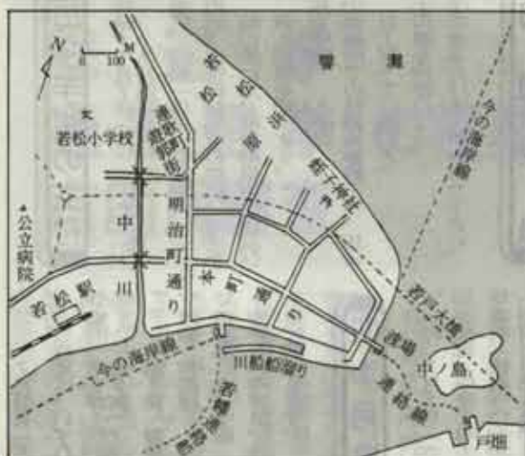
明治33年ころの若松村（一部推定） （明治8年・20年・昭和8年の地図による）

「しかし、このケンカで負ければ商店街の自己防衛はできなくなるばかりか、若松は無法地帯となる。これは絶対に負けられないケンカだ」と、自分で自分に言い聞かせて決心をした。