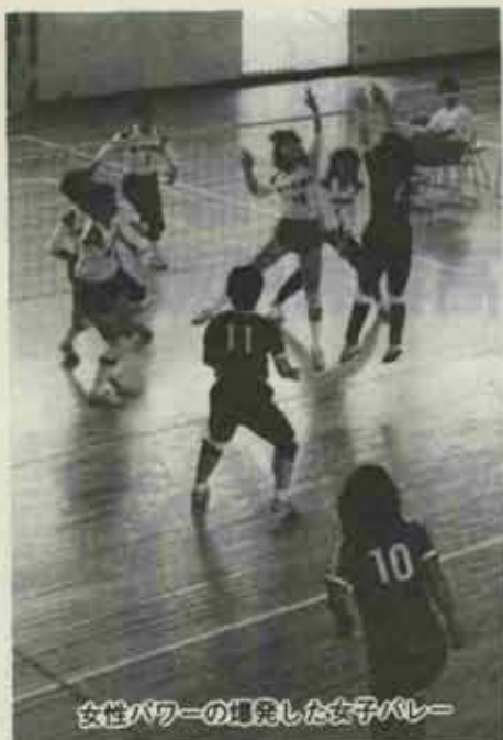
女性パワーの爆発した女子バレー