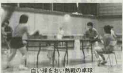
白い球をおい熱戦の卓球