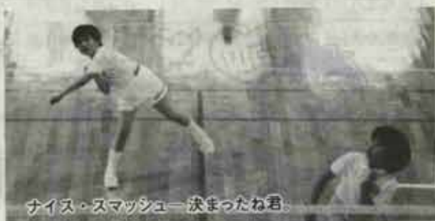
ナイス・スマッシュ—決まったね君