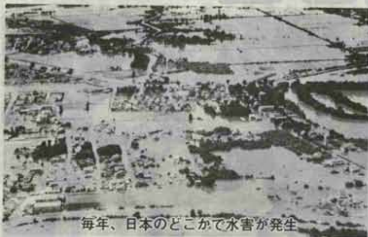
毎年、日本のどこかで水害が発生