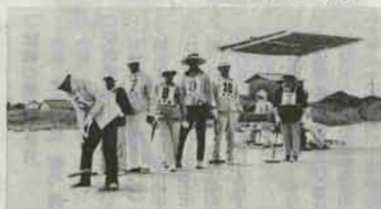
真刻にゲートを狙う選手たち