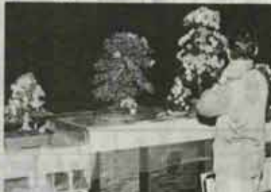
見事なサツキに見物人もうっとり