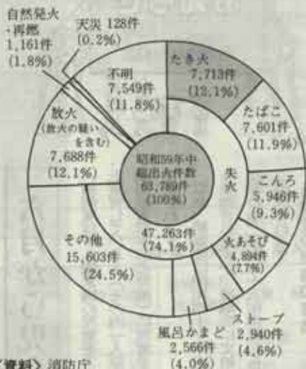
出火原因別出火件数

このようなことから、春の火災予防運動(二月二十八日と三月十三日)は「お年寄りや子供」など、自力避難が困難な人の死傷防止を重点目標とした