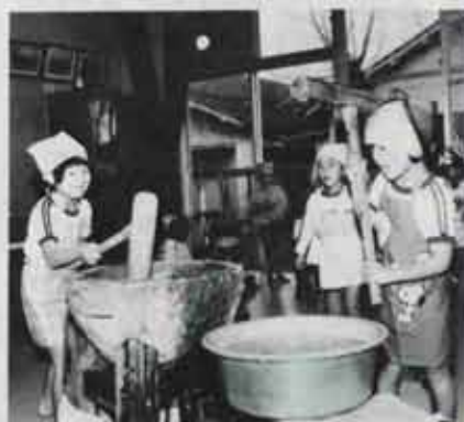
楽しいもちつき (第一保育園)