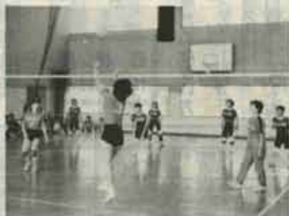
さわやかな汗を流してのレクバレー