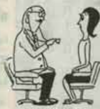
医師の診査 が必要です。

身体障害者福祉法の一部が改正され新たに「ボウコウ」「直腸」の機能障害の方で、人工肛門、人工ボウコウを付けておられる方は身障手帳の交付対象となりました。 該当される方は、役場社会課民生係で手続き書類をお渡しいたします。 詳しいことは、役場民生係か遺囑福祉事務所(電話601・2121)におたずねください。