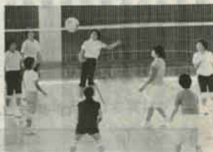
元気に大ハッスルのお母さんたち