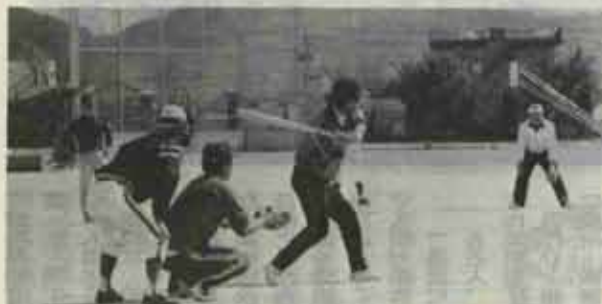
秋空の下でカブよいプレーを展開

澄みきった秋空の下、体育の日スポーツ行事として、社年ソフトボール大会と婦人レクリエーションボール大会と婦人レクリエーションボール大会が十月十四日に開かれました。会場の南中学校と吉田小学校には、各地区からソフトボール二十チーム、三百四十名、バレーボール十一チーム、二百九名が参加。家族や地区の応援をうけながら熱戦が繰り上げられました。試合の結果は次のとおりです。