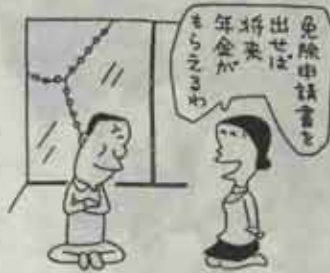
保険料の免除申請はお早目に

身体障害者福祉法の一部が改正され新たに「ボウコウ」「直腸」の機能障害の方で、人工肛門、人工ボウコウを付けておられる方は身障手帳の交付対象となりました。 該当される方は、役場社会課民生係で手続き書類をお渡しいたします。 詳しいことは、役場民生係か遺囑福祉事務所(電話601・2121)におたずねください。