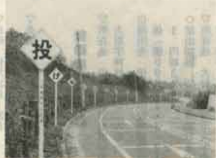
ドライバーに注意を呼びかける看板

車の中で放んだジュースの空きカンあなたはどうしていますか？まさか窓からボーイと捨ててはいないでしょうか。 九月二日、町内一斉に行なった空きカン・空きビン回収運動では車五台・六、九七〇個が集められました。 これは、アルミ缶だとなんと三万八、五〇〇の個になります。 この中には、あなたの捨てた物も入っているのでは。