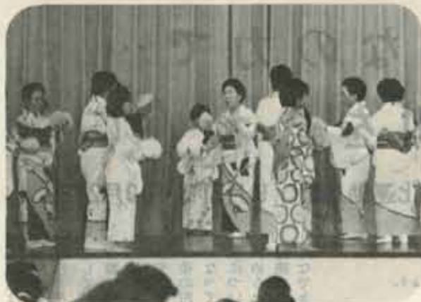
お年寄りと、子供たち、一緒に水巻音頭を元気に踊ります。