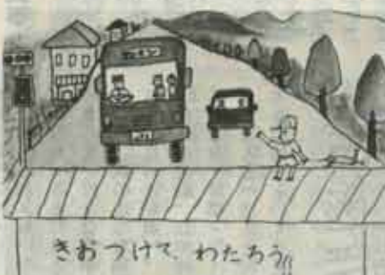
机小三年 こうろぎかよこ