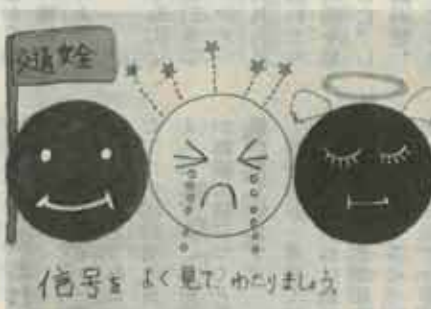
机小三年 なんば しず