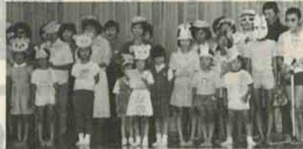
孫たちの歌にお年寄りも大喜び

九月十五日は「敬老の日」、水巻町内の各地区では、お年寄りを招いて多彩な祝典が行われました。踊りやカラオケを持ち込んだ、のど自慢、中でも孫たちの歌のプレゼントには、目を細めて喜んでいました。 町内の七〇歳以上のお年寄りは千八百九十三人、九〇歳以上の方は十八人おられます。もう役目は終わったと、楽隠居を決めこまず趣味を見つたり、ゲートボールを楽しんだり、生きがいや心の「はり」を見つけてみましょう。 おじいちゃん・おばあちゃん来年も元気にそろって敬老会に出席してください。