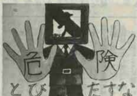
机小五年 高付 大助