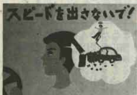
机小三年 ちぢわ あき