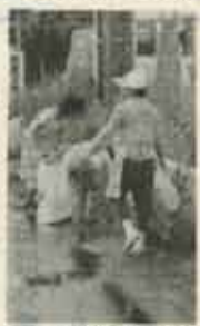
町あけての空きカン回収

車の中で放んだジュースの空きカンあなたはどうしていますか？まさか窓からボーイと捨ててはいないでしょうか。 九月二日、町内一斉に行なった空きカン・空きビン回収運動では車五台・六、九七〇個が集められました。 これは、アルミ缶だとなんと三万八、五〇〇の個になります。 この中には、あなたの捨てた物も入っているのでは。