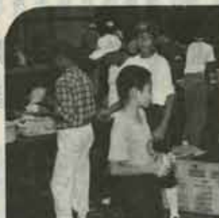
作るより食べる方がイヤノ

食事はやっぱり食べる方がいいやー。英彦山青年の家キャンプ場は、食事の準備でにぎやか。夏休み中の八月二十三日から二十五日まで、二泊三日のキャンプ研修が行なわれました。これは将来、地域やサトルのリーダーを養成しようとする