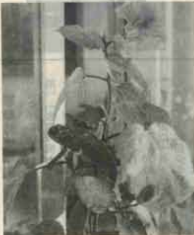
児童に人気のカメレオン

九月十五日は「敬老の日」、水巻町内の各地区では、お年寄りを招いて多彩な祝典が行われました。踊りやカラオケを持ち込んだ、のど自慢、中でも孫たちの歌のプレゼントには、目を細めて喜んでいました。 町内の七〇歳以上のお年寄りは千八百九十三人、九〇歳以上の方は十八人おられます。もう役目は終わったと、楽隠居を決めこまず趣味を見つたり、ゲートボールを楽しんだり、生きがいや心の「はり」を見つけてみましょう。 おじいちゃん・おばあちゃん来年も元気にそろって敬老会に出席してください。