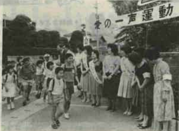
「おはようございます」と、元気よく登校する児童たち

「おはようございま〜す」。校門前に児童たちの元気な声が響きわたります。これは、猪熊小学校で行なわれている「愛のひと声あいきつ運動」での登校風景。 この運動は、ここ数年、親子の対話が少く、非行化に走る子が目立って来ている。同校でもその傾向にあったので、非行に走る子は無口になるという特徴があることに気付き、昨年四月から始められていた。「話させる 語りかける」ことで非行の芽を摘み取ろうとする試みです。 この運動には、学校とPTAが一体となり、六月と九月の年二回毎朝、父母と先生たちが校門前に