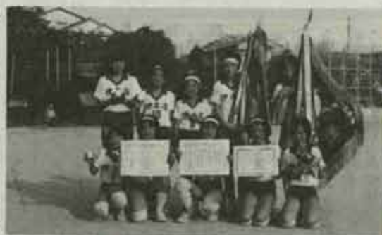
北九州市長杯を獲得した伊左座チーム