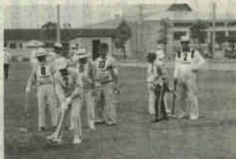
町内から20チームが参加して開かれたゲートボール大会(吉田球場にて)

今やゲートボールは、お年寄りの最大のスポーツ。競技大会も多くなりました。やもすると試合の結果だけに目が向きがちです。やはり、ゲートボールは、お年寄りの運動不足解消と親睦のためのスポーツ。のんびり、気楽にプレイしてください。