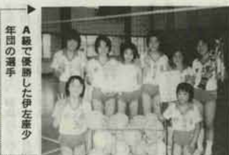
▲ A級で優勝した伊左座少年団の選手

新チームによる北九州少女バレーボール大会(北九州少女バレーボール連盟、北九州市教育委員会主催、読売新聞社後援)が去る四月二十二日、北九州市立総合体育館で行われました。A級二十チーム、B級五チームが参加、六コートに分かれて、父母ら家族の応援を受けながら、熱のこもった好プレーを繰り広げました。 A級では予選リーグを勝ち抜いた九チームで決勝トーナメントを行い、伊左座少年団が優勝。B級では頃末少年団が優勝。水巻町チームがタイトルを独占しました。