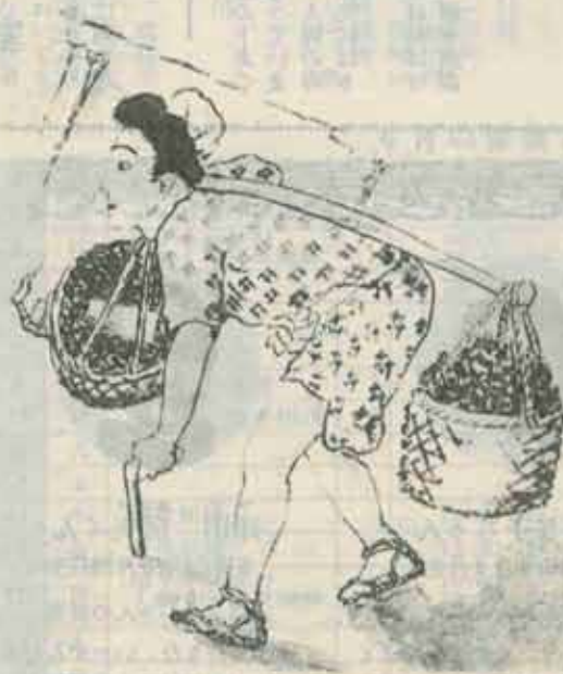
セナ棒 (山本作兵衛図集より)