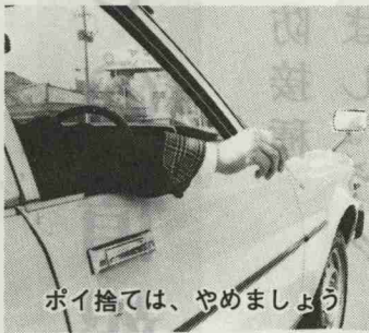
ポイ捨ては、やめましょう

☆タバコは、健康のために良くないと、喫煙者にとって厳しいご時世——。マナーだけは、きちんと守ってもらいたいものです。 ☆タバコの投げ捨てはしない。 ☆寝タバコはしない。 ☆灰皿は大きく深いもので、水を入れておく。