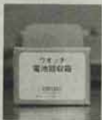
↑この箱に入れてね!

今度、日本電池・器具工業会からカメラ小売店、電気店等にボタン型電池の回収箱を置くことになりました。カメラ、電卓に使用した用済のボタン型電池については、ゴミ箱に