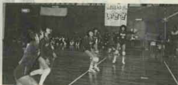
全試合ストレート勝ちの試合を展開する伊左座チーム

第二回北部地区九人制バレーボール大会が、去る三月二十五日、十七チームが参加し、中間市の体育文化センターで行なわれました。六年生最後の大会とあって、予選から熱戦が繰りひろげられましたが、予選、決勝トーナメントとも全試合ストレート勝ちの伊左座少年団が第一回大会に引き継ぎ二連覇しました。