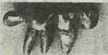
(下奥歯の銀冠の状態)

三月二十七日、青屋町山奥において白骨死体が発見されましたが身元が分かりません。 家出や所在不明などで心当たりの方は、最寄りの派出所、または折尾警察署まで連絡ください。 【死亡者の特徴】 ○推定年齢 40歳から60歳 ○身長 163センチメートル ○白髪既りの頭髪及び髭左下歯に銀合金の入歯 ○死後一年以上