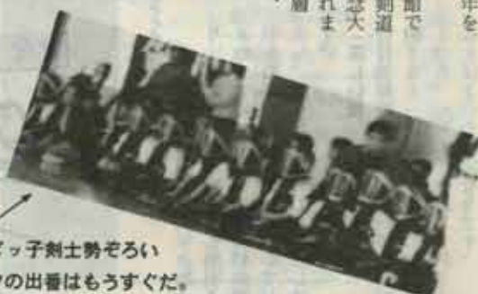
チビッ子剣士勢ぞろい。ボクの出番はもうすぐだ。

伊左座剣道スポーツ少年団が十周年をむかえました。 三月二十五日、伊左座小学校体育館で記念の剣道大会が行われ、町内の各剣道スポーツ少年団が集まり、十周年記念大会にふさわしい熱戦が繰りひろげられました。十年を一つの節目に、なお一層の団の発展を祈ります。ガンバレ、チビッ子剣士たち!!