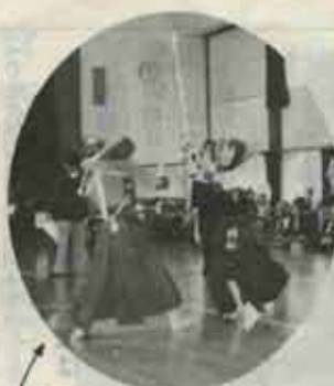
見事に一本決まるお面ーん

伊左座剣道スポーツ少年団が十周年をむかえました。 三月二十五日、伊左座小学校体育館で記念の剣道大会が行われ、町内の各剣道スポーツ少年団が集まり、十周年記念大会にふさわしい熱戦が繰りひろげられました。十年を一つの節目に、なお一層の団の発展を祈ります。ガンバレ、チビッ子剣士たち!!