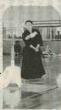
エーイ/ 気合と共に真二つ。 お見事な試し斬り。