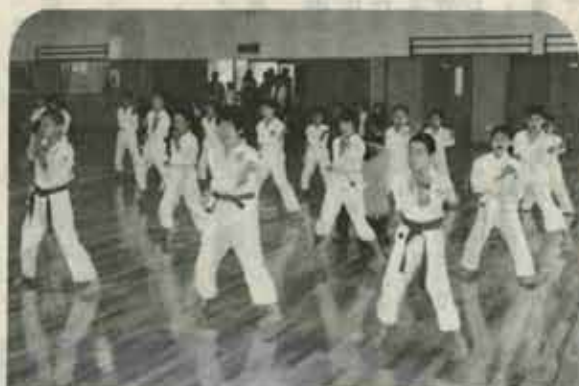
エーイ、ヤーと元気に空手の形を披露する少年団員

武道館の完成を記念して四月八日、剣道と空手道の愛好者やスポーツ少年団が集まり、演武会が盛大に行われました。 開会式では「武道愛好者の念願だった武道館も完成し、大いに利用され、心身の鍛錬と水巻町の武道高揚に活用して下さい」との来賓のあいさつがありました。武の後、特別招待の八幡大学居合同好会を始め町内の同好会員が演技を披露しました。 〔演技をされた方〕