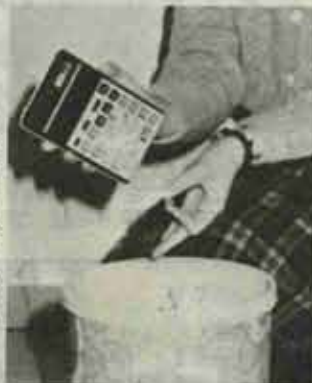
こみ箱には捨てないで