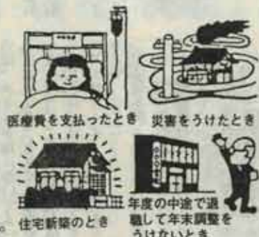
医療費を支払ったとき 災害をうけたとき 住宅新築のとき 年度の途中で退職して年末調整を受けないとき

更正の請求や修正申告をする場合の用紙は、若松税務署(☎761・2536)に用意してあります。