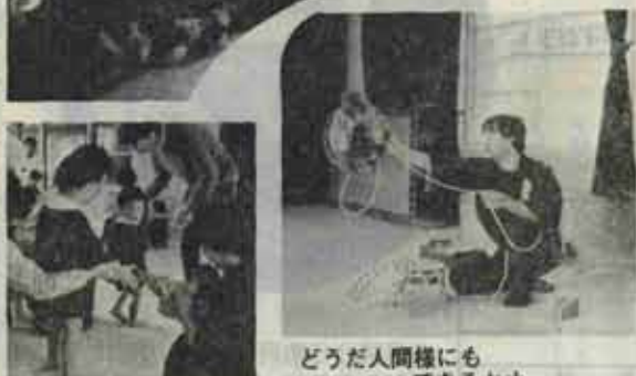
なかよくしょうネ。