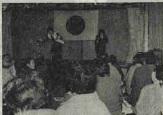
交通安全教室で熱演する婦警さん。

交通安全教室では、お年寄りが外出する時の注意事項などを、折尾警察署交通課の婦警さんが演じる劇で、おもしろく、わかりやすく、お爺ちゃん、お婆ちゃんに説明し交通事故に合わないで、長生きしてくださいと、孫のような婦警さんの熱演に、盛んにうなずき、拍手をお送っていました。