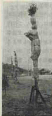
校庭の緑化が進みます