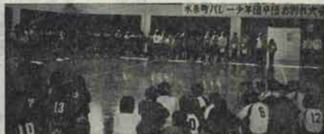
試合後、後輩たちから盛大に送られる卒団生

試合の結果、予選、決勝トーナメントともにストリート勝ちの伊左座少年団が優勝しました。