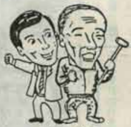
世代と世代の助け合い

10年年金は月三万三百七十五円に引き上げ予定 保険料を納めた期間が一定期間以上ないと受給できないことになっています。万が一の事故に備えて保険料はキチンと納めましょう。年度末にあたって納め忘れがないかもう一度確かめてください。