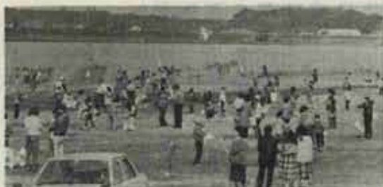
全児童が参加しての「たこ揚げ大会」