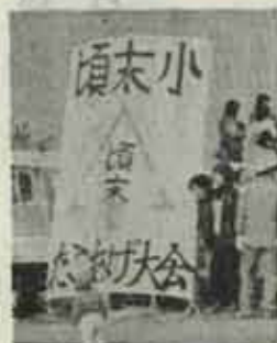
ついに揚がらず、大たこ