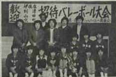
全試合ストレート勝ちで優勝した伊左座バレー少年団

昨年夏の全国小学生バレーボール大会・県大会出場チームを招待しての六人制招待バレーボール大会が、去る二月十九日柏屋郡須恵町二小体育館で開催されました。試合は、招待六チームの総当たりリーグ戦で行なわれましたが、全国大会出場の到津クラブを2-0で破ったのをはじめ、全試合ストレート勝ちの伊左座バレー少年団が見事優勝しました。