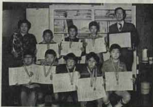
児童画作品展で特選となった児童と深町校長先生・大員先生

第三十二回福岡県小学校児童画作品展で杓小が毎日新聞社賞を受賞しました。昨年に続いての受賞です。この作品展は、「自然に親しみ豊かな心を養おう」ことをテーマに毎年開かれ、絵画、版画、デザインの三部門に分かれて力量を競います。