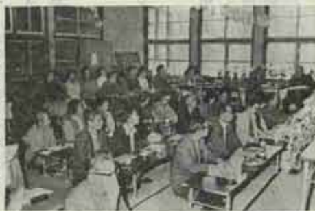
日頃の練習の成果を披露する水巻短歌会の皆さん