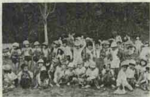
これ！ほくたちが作ったイモです

六年生は、ピョン飼育のし方を次々と工夫して、ピョンの反応を観察した。また、この外にも同校では、季節の野菜や花を植え、発育を観察させています。子供たちの作った