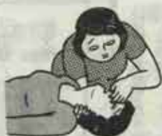
①あお向けに寝かせ、息が通りやすくする(気道確保)