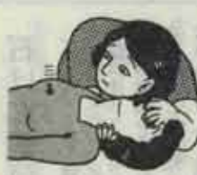
③口を離し、胸が沈んで息が吐き出されるのを確かめる