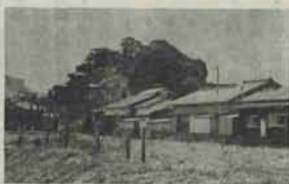
哀れな平家の落武者の自害あと十三塚

壇の浦で敗れた平家の家臣が敗残の姿もいたましく、江川の方からや々とある山にたどりつき、山の頂上からはるかに古賀岳(豊前坊山)の山鹿遠の端城