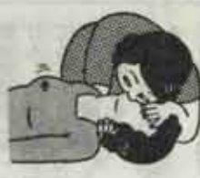
②胸がふくらむまで息を吹き込む