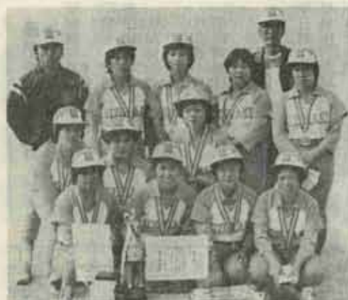
北九州市の強豪を相手に健闘した水巻マザーズのママさんたち

初のリビング北九州杯 水巻マザーズ準決勝まで進出 ママさんソフトボール大会 リビング北九州杯をかけた第一回ママさんソフトボール大会が、九日午前九時から北九州市八幡東区の桃園競技場で、十六チームが参加して行われました。水巻町からも水巻マザーズが出場し、よく健闘して準決勝まで進み、おしくも井端クラブに7-6で敗れました。 晴天に恵まれ、この日は朝から強い日差しが照りつける中、ママさんたちは、したたり落ちる汗をぬぐおうともせずひたすら白球を追いかけていました。北九州市内の強豪を相手に堂々準決勝まで