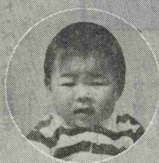
ひろき 打和大幹ちゃん(頃末)