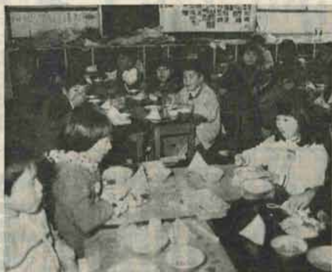
子供たちにも好評な米飯給食

っており、付出し、果物もついておいしいごはんで児童もうれしくおいしく寝食をとっております。米飯給食の実施による米の消費量を調べてみますと、本町五小学校の児童、教員等、二千八百名分の給食を作ることにありますので各学年別に基準量をかけて総合いたしますと一回当りの米の量は約二五〇キログラムあります。毎週一回の米飯として年約四〇日計算しますと年間一〇トン(約一七〇俵)が必要になり、これは水巻町内の農家より政府が買上げた四五トン(七五〇俵)の約二・二%に当ります。この米飯給食のとり入れは単なる米の消費の拡大ばかりでなく、現在の食生活