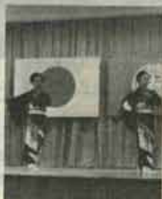
表彰式典で見事な舞臺を披露する若峰流の方々