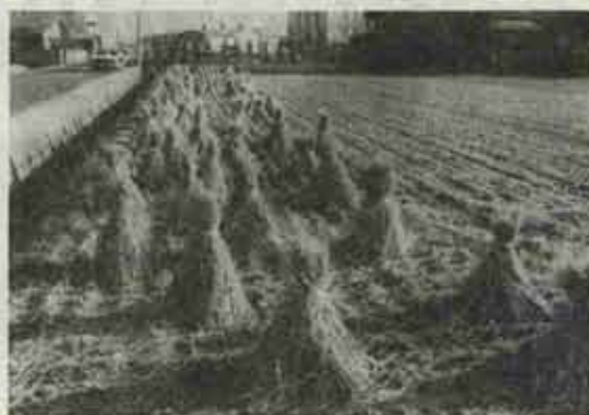
きれいに刈り取られた田んぼ

つづいて料理を食卓に並べて試食会にはいりました。試食会には食通の町職員数名を交えて行なわれ、楽しい有意義なひとときを過ごしました。まだまだアイデア次第ではこめは利用度も広いと言う声が多く今後2回程予定しておりますが、次回の開催をたのしみにしていました。