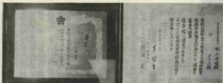
県教育委員会の表彰状

給食内容の充実面がうかがわれます。また、ソニー理科教育振興資金優良校の優良校にも選ばれました。同校は、恵まれた自然環境を活用し、理科学習は、自然に親しむ活動づくり、をモットーに児童が自から花やイモなどを育て、その発育を観察させています。一人一鉢栽培を実施しており、今、子供たちの育てた菊が見事な花を咲かせています。