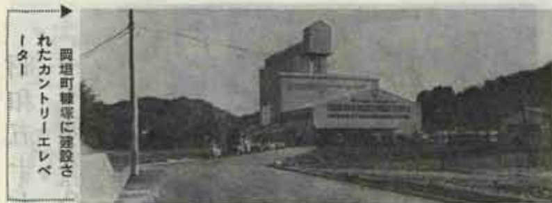
岡垣町農家に建設されたカントリーエレベーター

カントリーエレベーターという聞きなれない言葉ですが訳しますと大型乾燥調整貯蔵施設となります。農家では今まで刈取った籾を乾燥して、もみすり機にかけ玄米にして農協に出荷していましたがこの大型貯蔵庫が建設されたので刈取ったもみのまま田んぼから直接この施設に配送すればいいこと