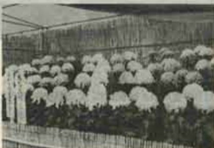
大きな花輪をつけた菊

見物におとずれた人も、一つ一 つの作品の見事な出来栄えに見と れて、しばし立ち止まっています。 また、俳句、短歌の会では、 それぞれ会を開き、日頃の練習の 成果を披露しました。そのも よは次回お知らせします。