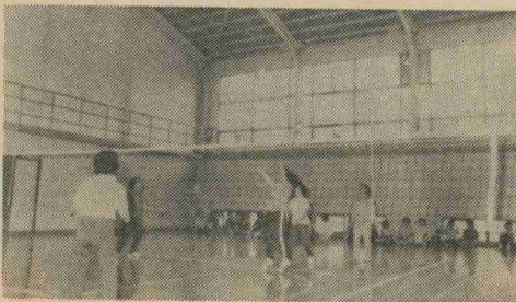
ボールがなかなか落ちて来ません(ビーチバレー)

ビーチバレーとは、バレーボールと同じですが、ボールはビーチボールを使用します。普通のバレーボールのように動きは厳しくなく、突き指もありません。年輩の方もできます。 家に、こもりがちな奥さんには最適な運動です。是非始めてみましょう。始めてみようとお考えの方は、教育委員会に問い合わせてください。