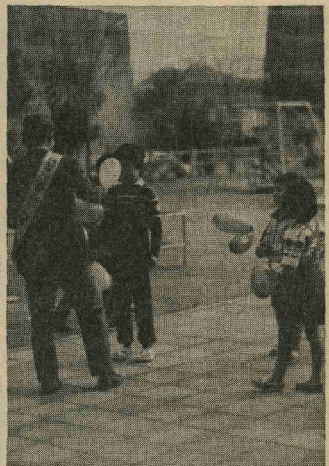
子供たちに情宣活動をする防犯委員