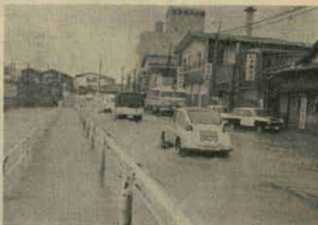
5年前の飢害復旧前の逓信本店前街道

今年も梅雨の時期を迎えましたが、あなたの水害に対する備えはもうできていますか。 町では、この梅雨時期の水害を防ぎ、また住民の被害を最小限に食い止めるため各関係機関が集った「水害防水防協議会」を五月三十日開催し、水防対策を検討した結果、水防計画を次のとおりまとめました。