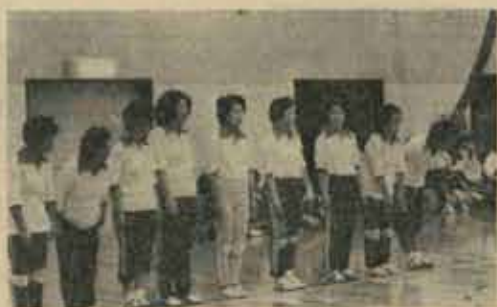
優勝の古賀チーム