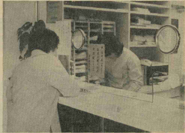
苦しくなつていく 国保財政

国民皆保険制度となつて国民健康保険もわたしたちの生活に深く根をおろし、なくてはならない制度となつていきます。 しかし、一方では、増える医療費のために国保財政は苦しくなり、被保険者のみなさんに負担増を強いる結果となつていきます。 いったい、国保財政はどのようなしくみになつていくのでしょうか。