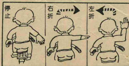
自転車を運転するときの停止、右・左折の合図

自転車に乗っていて、思わずヒヤッとした経験は、どなたにも一度や二度は必ずあるはずですが、自転車にも、交通ルールはあります、必ず右、左、停止の合図を正確に守りましょう。