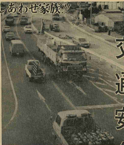
工事で渋滞する3号線

人(28%減)減となっていますが、発生件数で二百七十三人(30%増)増えています。