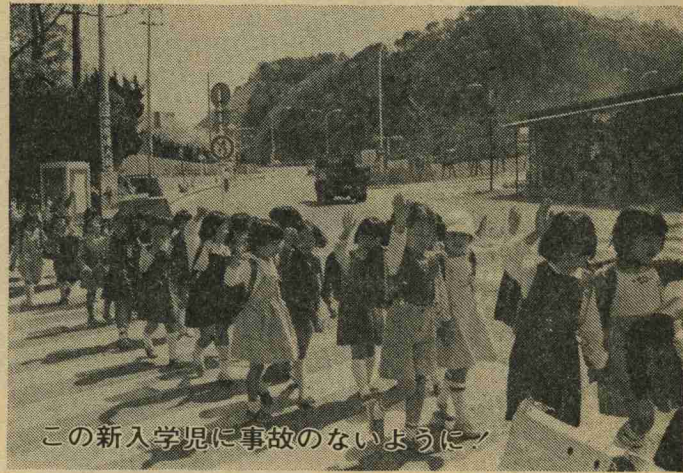
この新入学児に事故のないように