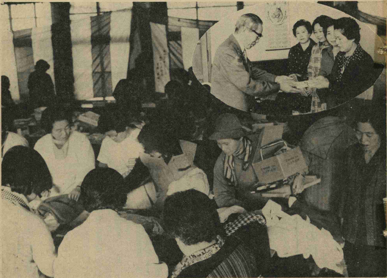
円内は益金を社会福祉協議会に寄贈する婦人部のかたがた