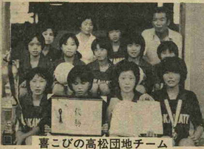
喜びの高松団地チーム