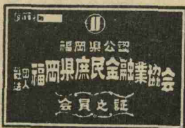
加入業者にはこの看板があります