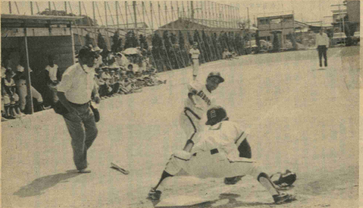
頃末チーム惜しくも追加点ならずタッチアウト(中学生の部)