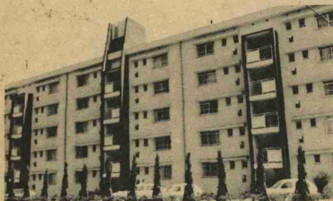
簡保資金で建てられた高松改良住宅