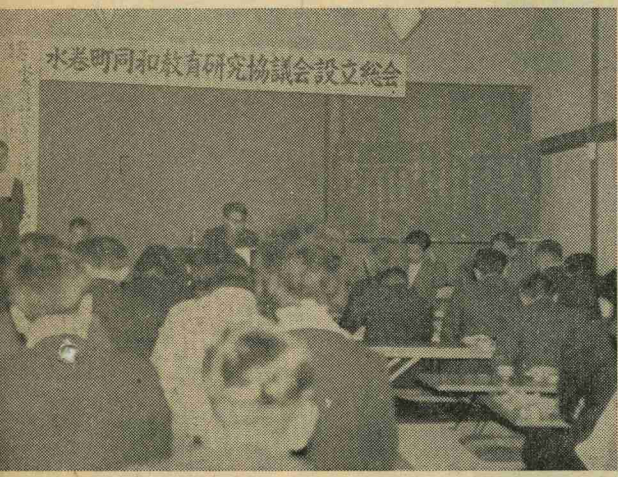
推進するため、3月19日町の社会関係者・区長・婦人会役員を同和教育研究協議会の設立総会が開かれました。