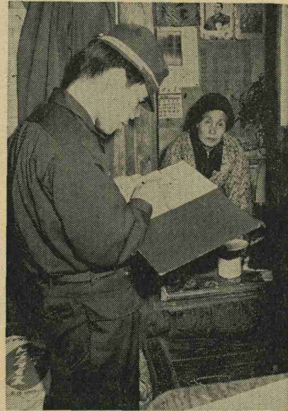
「おばあちゃん、火事になれば火を消すよりも逃げることですよ」

火災での老人の死亡率は非常に高く、昭和四十九年度の全国の火災での死亡者一千六百四十六人のうち老人(六十一歳以上)の死亡者は、六百十一人と実に全体の三七割も占めています。 これは、火災が発生したときにどのようにすればよいのか判断が