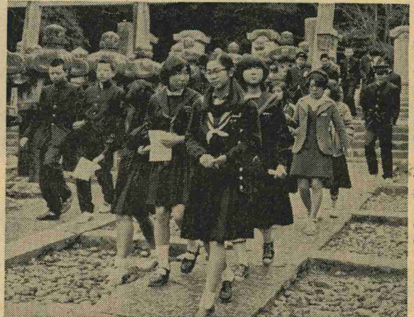
萩市では史跡めぐりで楽しいひととき。