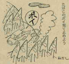
山火事防止 たばこのポイ捨てはあつち

延納制度 税額が5万円以上で、一度に納付が困難な場合は、手続きをすると5年以内の延納ができます。(年利6.6%)