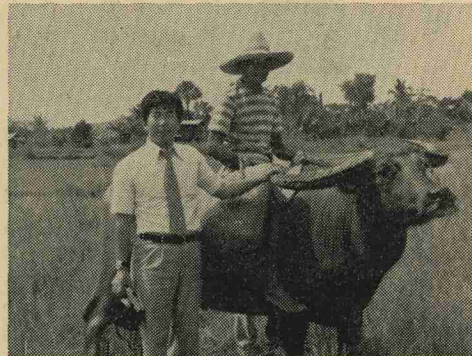
フィリピンでは日本で見られない光景がいっぱい

船の中では、福岡県から集った青年三百名が各班に分けられ、一日一日の行動スケジュールが決