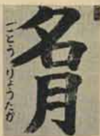
三年 ごとうりょうたか