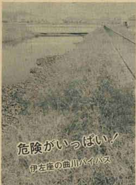
危険がいっぱい! 伊左座の曲川バイパス