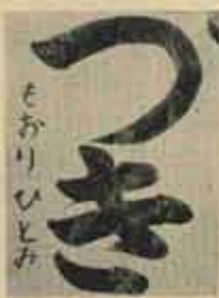
一年 もおり ひとみ

三年以上は何とんでもベテランぞろいの感じで、筆使いも結体もほとんど作品の差がなく、同一程度であったことはよろこばしいことで、順位をつけることに困難を感じた。はじめて審査にあたって児童生徒の勉強ぶりと、先生方のご指導のみにりに大いに敬意を表します。