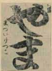
二年 まつい りつこ