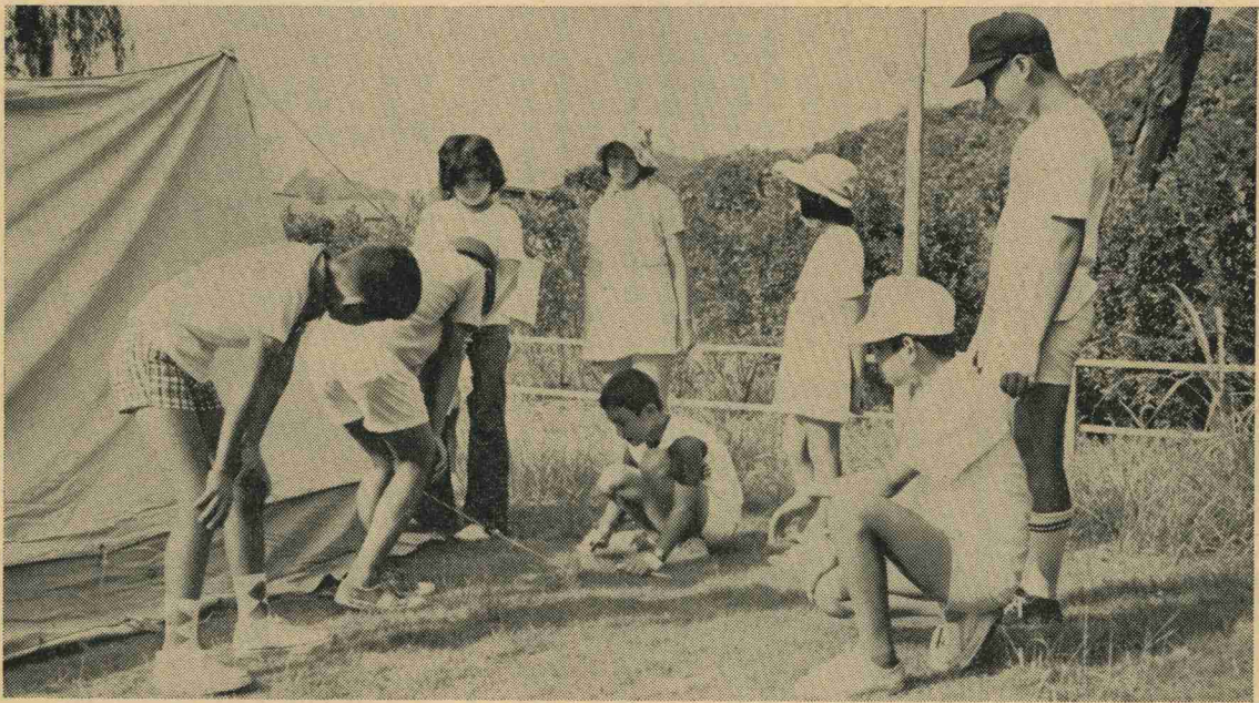
テントの張り方を習ったあと、実際に自分たちだけで張りました