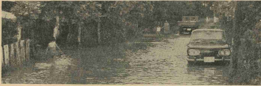
豪雨のため水の溢れたときの鯉口地区