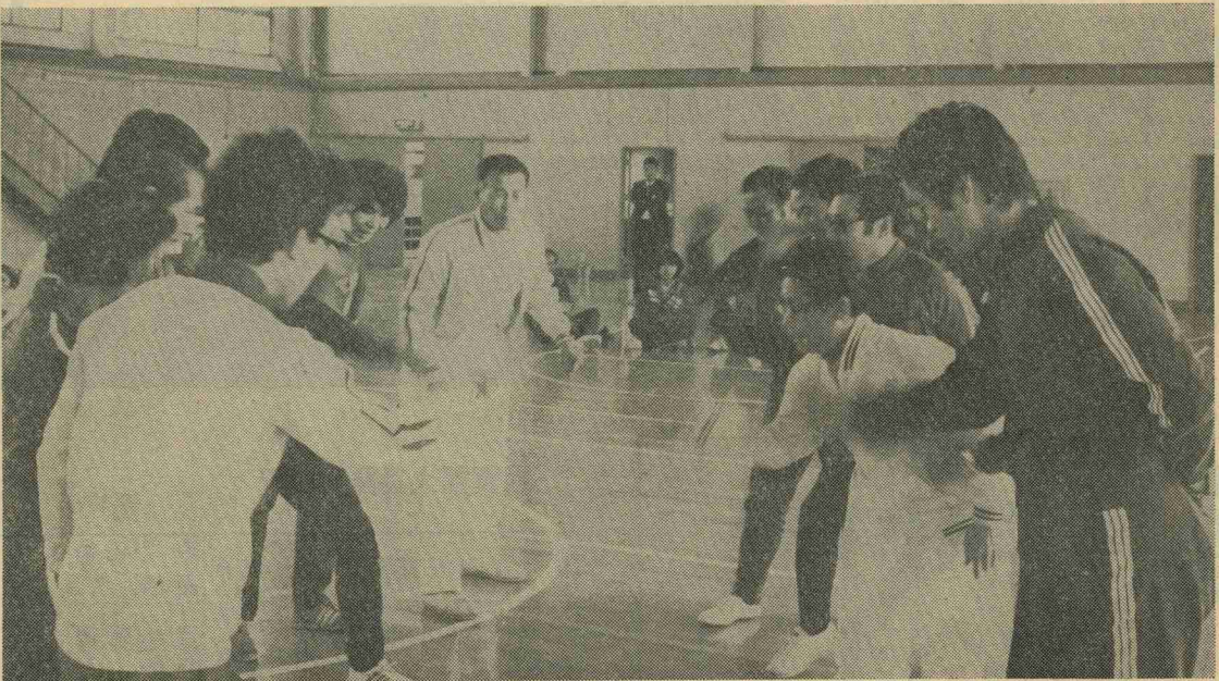
レクリエーションの一つ、六人組ジャンケンゲームの練習をする指導者の方たち