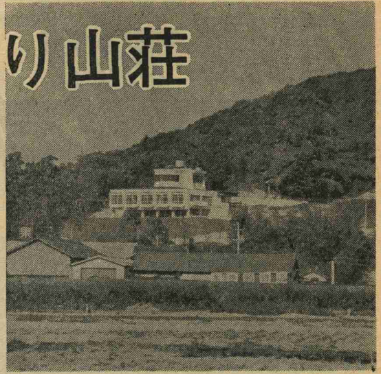
名称も決まり、落ちついた、たたずまいを見せる「えぶり山荘」