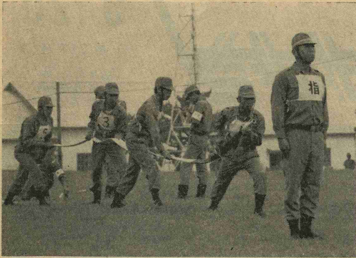
郡大会では、バツグンの成績で優勝、わずかな時間で、気合いの入った見事なポンプ操法を見せる水巻町消防団

これは、先に行われた郡の大会で優勝し、代表チームに選ばれたものですが、代表となつてからは