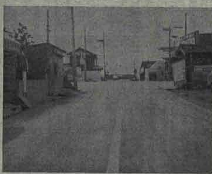
44年度の町道舗装率11・7%に比べ現在は31・2%。格段によくなったがまだまだ要望は強い。

無くなった旧日炭社宅の整理と、あと地を利用しての公営住宅建設は町の重要政策だが、早急な整備を望む声が高い。写真は橋ノ木区