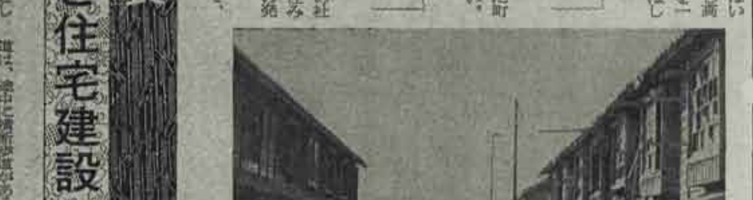
無人となった旧日炭社宅の整理と、あと地を利用しての公営住宅建設は町の重要政策だが、早急な整備を望む声が高い。写真は橋ノ木区

無くなった旧日炭社宅の整理と、あと地を利用しての公営住宅建設は町の重要政策だが、早急な整備を望む声が高い。写真は橋ノ木区