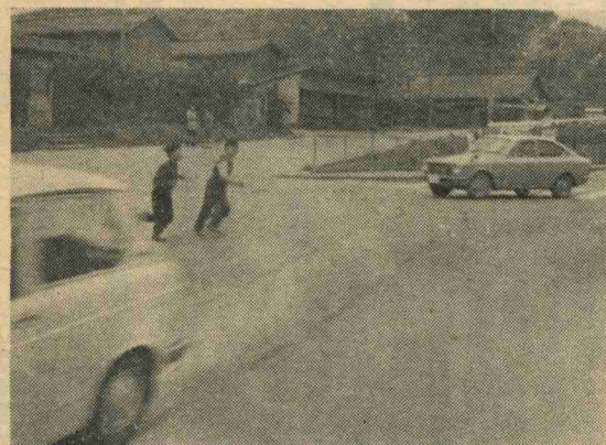
△道路を横断するときは、かならず横断歩道を渡りましょう

秋の交通安全運動が九月二十七日から十月六日まで全国一斉に実施されます。 これから行楽シーズンとなり、交通事故も起りやすくなります。 運転者も歩行者も交通法規を守り事故防止をはかりましょう。