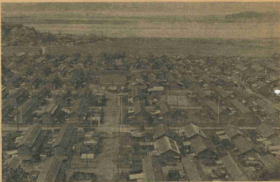
閉山の事態に不安につつまれる社宅 (古賀区)