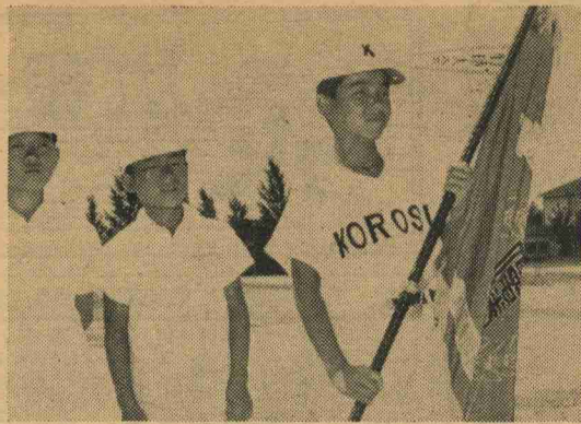
小学生の部優勝した頃末地区チーム

第5回水巻町少年野球大会が、8月4日から8月10日までの1週間、水巻中グラウンドで行なわれ、梅ノ木区(中学校の部)が2回優勝し、頃末地区(小学生の部)が初優勝した。 これはスポーツを通じて夏季における少年の心身練磨と体力の向上をはかり、あわせて青少年の健全育成を旨として行なわれるもの 試合は熱狂する父兄の声えんの中で、頃末地区(小学校の部)・梅ノ木区(中学校の部)2回戦、梅ノ木区(中学校の部)が優勝し、頃末地区(小学校の部)が初優勝した。 これはスポーツを通じて夏季における少年の心身練磨と体力の向上をはかり、あわせて青少年の健全育成を旨として行なわれるもの