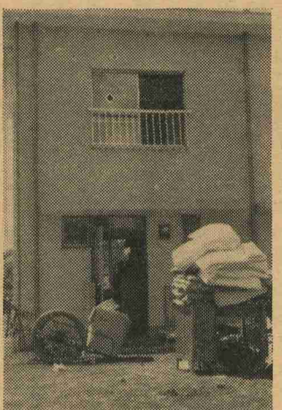
完成した吉田住宅の入居風景

8月末までに入居完了予定 一畠の吉田地区に建設中でし、吉田改良住宅昭和43年度分34戸が8月に完成しました。 建物はクリム色の簡易耐火構造の2階建てのモダンな建物で6棟建ちました。完成した建物の隣りでは、昭和44年度分228戸が建設を急いでおり、昭和45年1月には建ちあがる予定です。さら